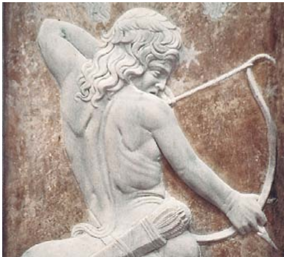
Cappella detta dei Pianeti: particolari dei bassorilievi di Agostino di Duccio, Tempio Malatestiano, Rimini