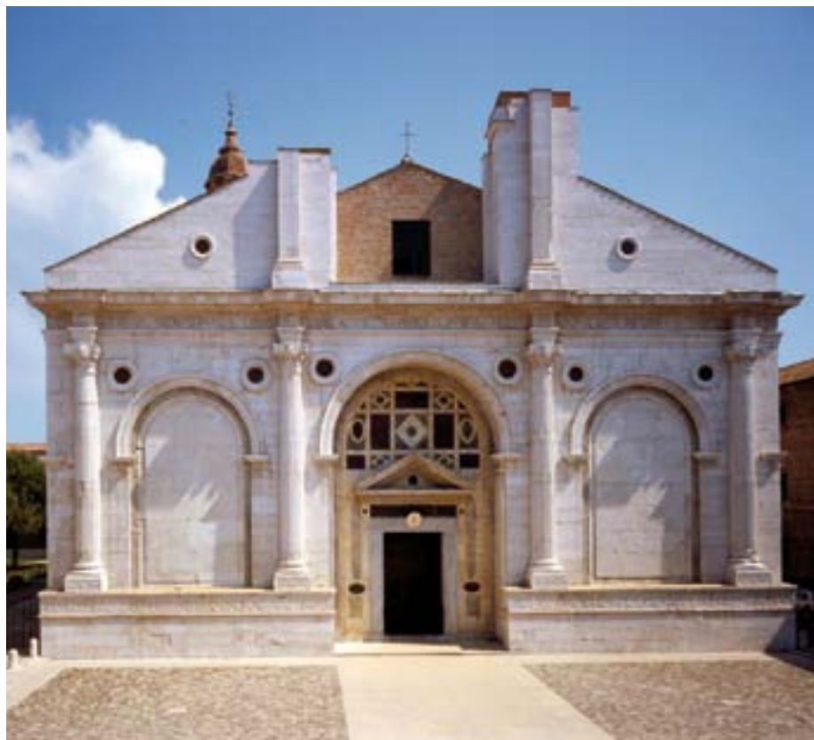
sopra il Tempio Malatestiano di Rimini a sinistra Sigismondo Pandolfo Malatesta (particolare) nell'affresco di Piero della Francesca, Tempio Malatestiano di Rimini